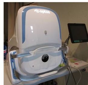
オプトスカリフォルニア

瞼をしっかり押さえさせていただき、機械に顔を押し付けるようにして撮影します 少し大変ですが撮影は短時間で済みますので、ご協力お願い致します。