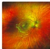
オプトスカリフォルニアで撮影できる範囲